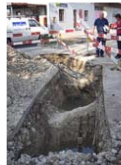
Leck in der Zuleitung zum Bahnhof. Ein provisorischer Anschluss ist bereits erstellt (30. Juni 2009).

auch für die Wasserversorgung grössere Aktivitäten aus. In diesem Bereich ist die Hauptleitung zwar neueren Datums, Probleme entstanden jedoch in der Bahnhofstrasse. Diese Leitung zweigt aus der Weissensteinstrasse ab und unterquert den Wildbach, welcher beim Bau der Bahnhofstrasse noch nicht eingedolt war. Rasch wurde klar, dass für den Neubau der Leitung aus Kosten- und Termingründen ein anderer Weg gefunden werden musste. Als neue Lösung bot sich an, ein Stahlrohr in die vom Kanton ausgeführte Verstärkung der Bachüberdeckung einzubetonieren. In dieses Schutzrohr wurde anschliessend die Wasserleitung eingeschoben. Mit zusätzlichen Anpassungen konnten weitere Bachunterquerungen von alten Hauszuleitungen eliminiert werden. Mit diesen Massnahmen ist sichergestellt, dass die sanierte Strasse in den nächsten fünf Jahren nicht aufgegraben werden muss.