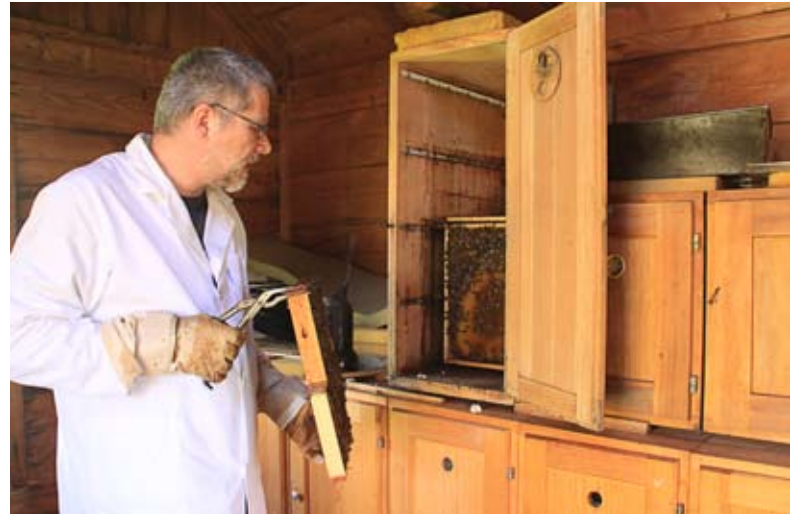
Kontrolle der Brut. Aus den braunen Zellen im Zentrum der Wabe schlüpfen die Bienen. Am Rand sichtbar die helleren grösseren Zellen der Drohnenbrut.

sollte ich die Völker auf neue Königinnenzellen prüfen, damit es nicht zu viele Schwärme gibt. Dann kommen die Honigrähmchen zu den Völkern. Je nach Tracht, das ist abhängig vom Wetter und Pflanzenangebot, kann ich ein- oder zweimal Honig schleudern. Das ist die körperlich anstrengendste Arbeit: Die Honigwaben herausnehmen, die Bienen abklopfen, die Waben in einer Transportkiste in die Waschküche tragen. Dort müssen die Waben entdeckelt und geschleudert werden. Den Honig vom Kessel in die Gläser füllen und die Gläser etikettieren. Ende Juli kann ich den Blatthonig ernten, Honigwaben abräumen und die Völker gegen die Varroamilbe behandeln. Dann füttere ich die Bienen für die Winterruhe mit Fruchtzuckersirup. Zuletzt packe ich die Völker warm ein für den Winter.