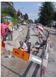
Baustelle Rüttenenstrasse am 25. August 2009.

Das grosse, mehr als zwei Jahre dauernde Umbauprojekt der MIGROS bedingte die Neuverlegung fast aller Wasserleitungen in diesem Areal. Der grösste Teil dieser Anpassungen ist, bis auf ein Stück der Fabrikstrasse, abgeschlossen. Die Planung dieser Grossbaustelle erforderte besondere Anstrengungen seitens der Bauleitung und höchste Flexibilität aller Ausführenden.