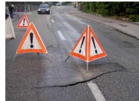
Schadenbild nach dem Leitungsbruch in der Rüttenenstrasse (4. Mai 2009).

auch für die Wasserversorgung grössere Aktivitäten aus. In diesem Bereich ist die Hauptleitung zwar neueren Datums, Probleme entstanden jedoch in der Bahnhofstrasse. Diese Leitung zweigt aus der Weissensteinstrasse ab und unterquert den Wildbach, welcher beim Bau der Bahnhofstrasse noch nicht eingedolt war. Rasch wurde klar, dass für den Neubau der Leitung aus Kosten- und Termingründen ein anderer Weg gefunden werden musste. Als neue Lösung bot sich an, ein Stahlrohr in die vom Kanton ausgeführte Verstärkung der Bachüberdeckung einzubetonieren. In dieses Schutzrohr wurde anschliessend die Wasserleitung eingeschoben. Mit zusätzlichen Anpassungen konnten weitere Bachunterquerungen von alten Hauszuleitungen eliminiert werden. Mit diesen Massnahmen ist sichergestellt, dass die sanierte Strasse in den nächsten fünf Jahren nicht aufgegraben werden muss.