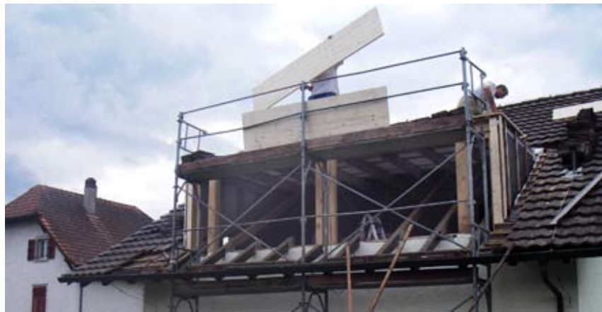
Zimmerleute an der Arbeit für den Ausbau des Bürgerhauses (22. Juni 2009).

Gut sichtbar ist der gelungene Ausbau des Bürgerhauses. Nach der Renovation der Aussenhülle im Jahr 2008 konnte letztes Jahr mit dem Einbau eines Büroraumes im Dachstock ein seit langem vorhandenes Platzproblem gelöst werden. Nach den Plänen von Architekt Egon Bessire entstand ein ansprechender, heller Arbeitsraum für die Verwaltung. Ausgelöst durch die Bauarbeiten, drängten sich einige weitere Massnahmen auf, wie die Verbesserung der Gebäudeisolation und