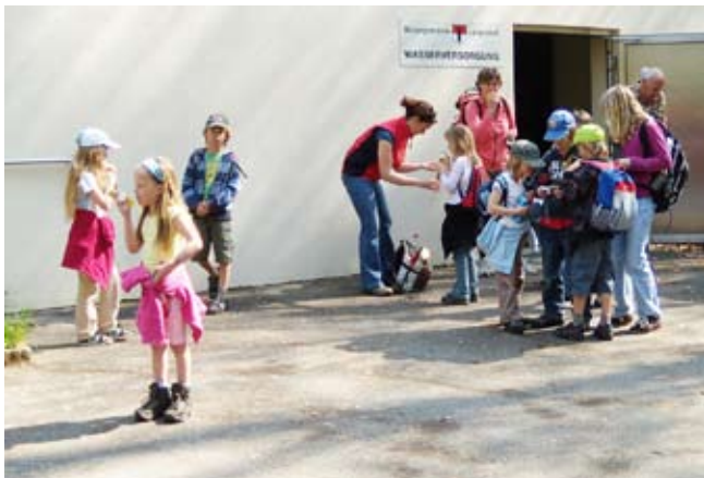
Die Ferienpass-Gruppe vor dem Pumpwerk Steinsäge, bereit zum Abmarsch Richtung Reservoir (14. April 2009).