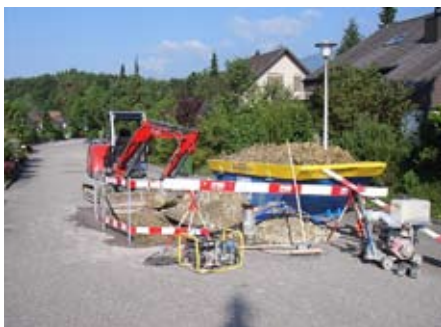
Ein «gewöhnlicher» Leitungsbruch in der Allmendstrasse am 30. Juni 2009.